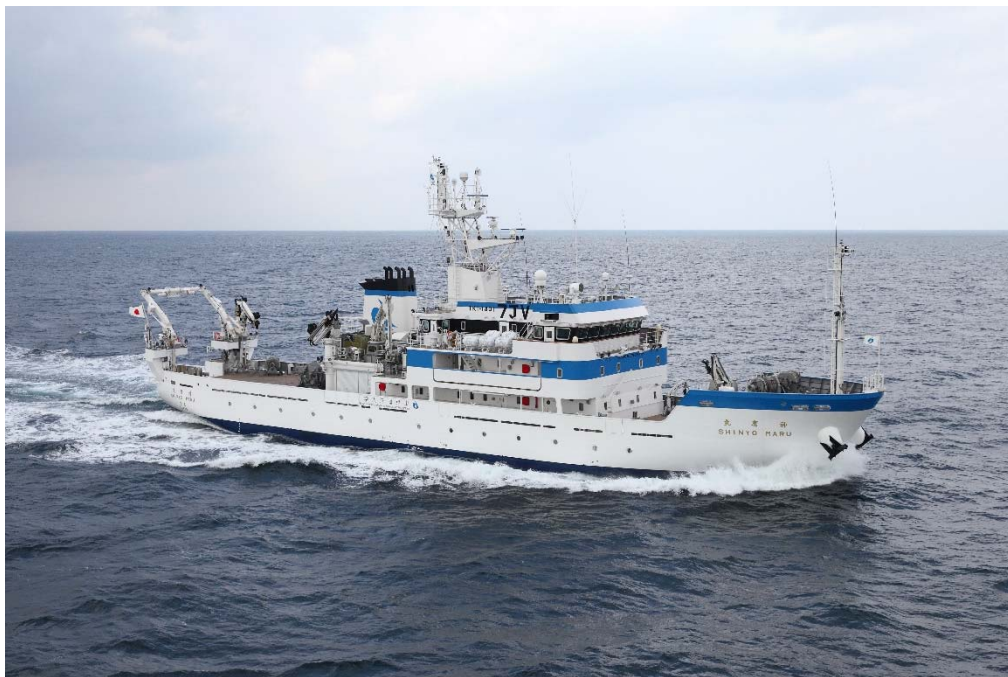
（東京海洋大学 練習船 神鷹丸 2016年4月就航）

https://www.kaiyodai.ac.jp/overview/announcement/access/shinagawa.html